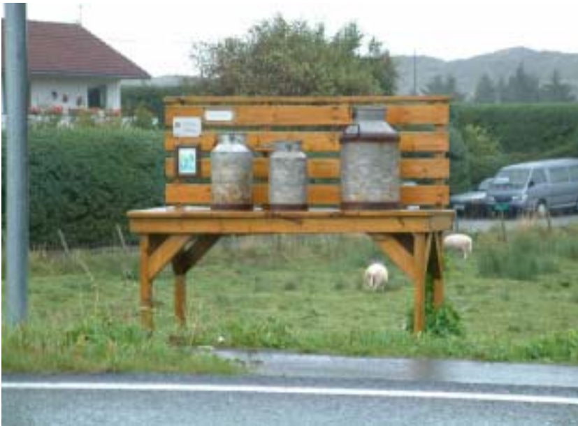
Melkekrakk på Liknes

For å bevare minnet om en viktig del av vår gamle jordbrukskultur har vi laget en tro kopi av en gammel melkekrakk med autentiske melkespann, og satt den opp ved hovedvegen på Liknes.