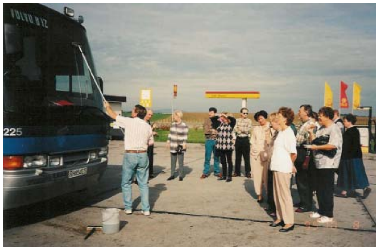
På vei til Budapest. Bussen må holdes ren!