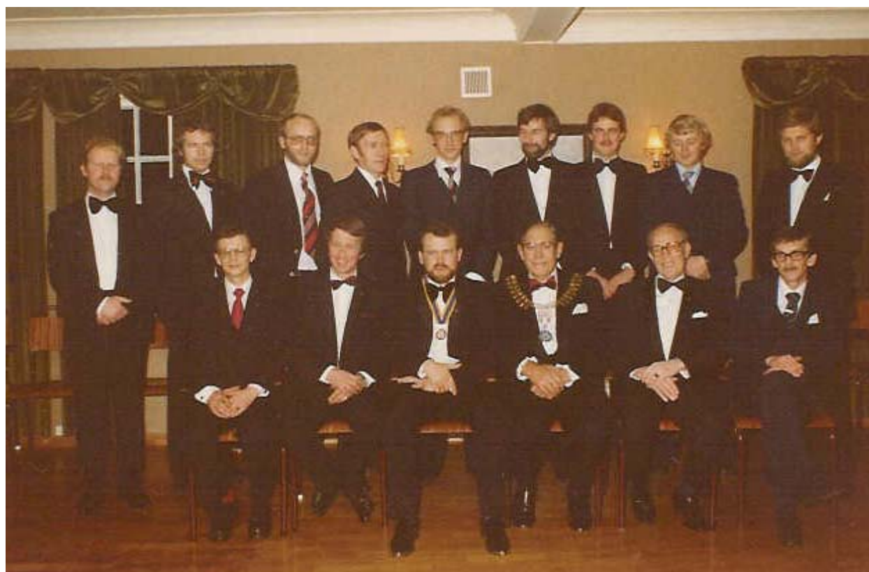
Charterfesten 30. november 1979

Karmøy Vest Rotaryklubb ble chartret den 20.oktober 1979, og vel en måned senere, den 30. november, ble charterfesten avholdt i selskapslokalene til Skudeneshavn Sparebank, med 52 personer til stede. Guvernør Bjørn Fraser holdt hovedtalen før han festet nålen på jakkeslaget til medlemmene av den nye klubben, og ønsket oss lykke til med rotaryarbeidet framover.