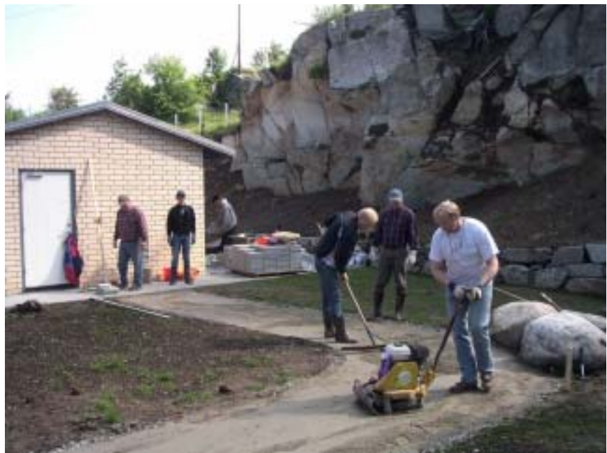
Legging av heller på Fredheim

Et tiltak vi har arbeidet med i den siste tiden er å gjøre utearealene ved det nye Fredheim Bufellesskap i Sævelandsvik mer trivelige. I samarbeid med ledelsen ved institusjonen har vi derfor skaffet til veie planter og heller til sansehagen, og har også ved dugnadsinnsats lagt hellene i hageområdet.