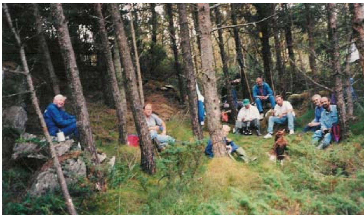
Kvisting i marka

Vi har arrangert dugnader i Karmøyheiene der klubbmedlemmene har drevet med kvisting i skogen og rydding av tursti rundt Aureivatnet.