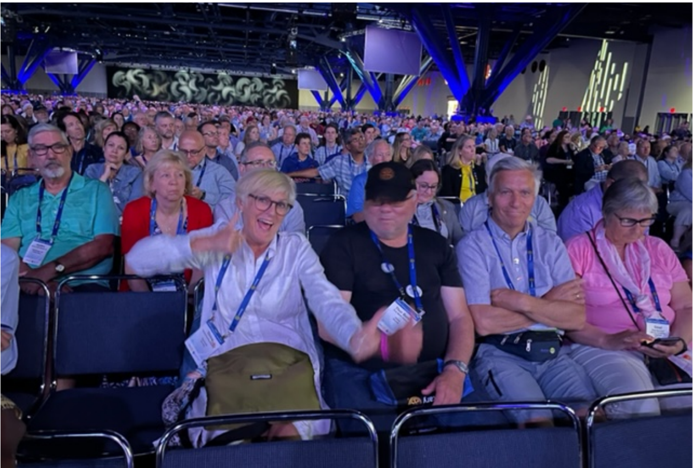
Gøy på Convention!