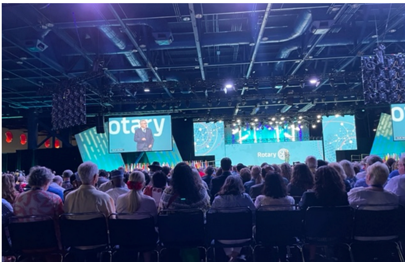
Store skjermer så lett å få med seg alt som foregikk på scenen