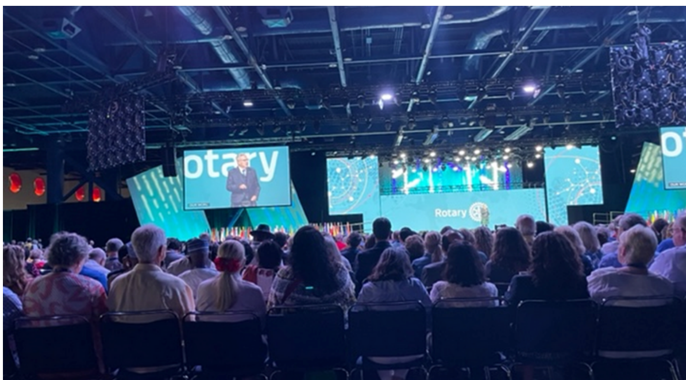
Store skjermer så lett å få med seg alt som foregikk på scenen