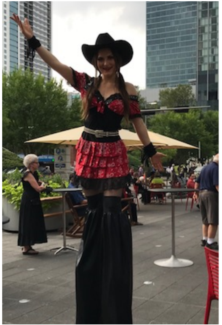
Cowgirl med lange ben