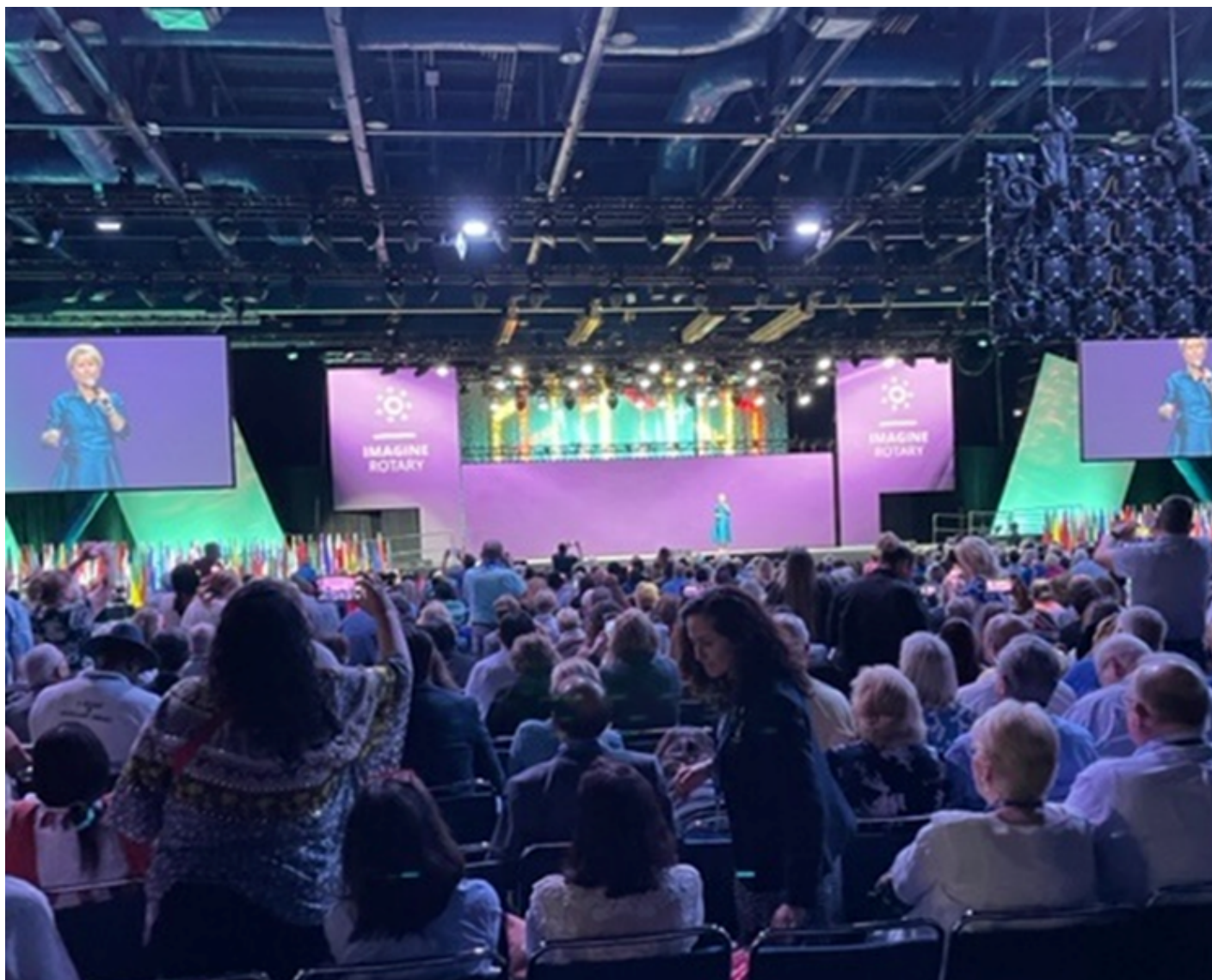
RI-President 2022-23 inspirerer