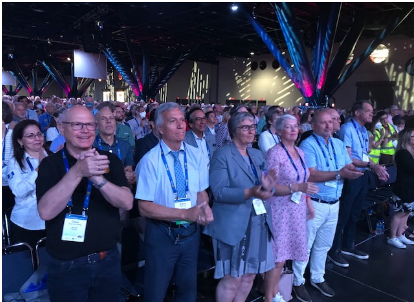
Litt av den norske delegasjonen