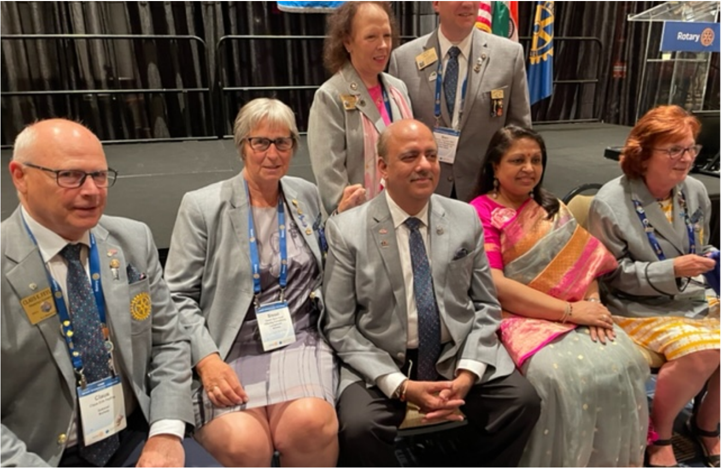
Noen Distriktsguvernører i møte med RI Presidenten