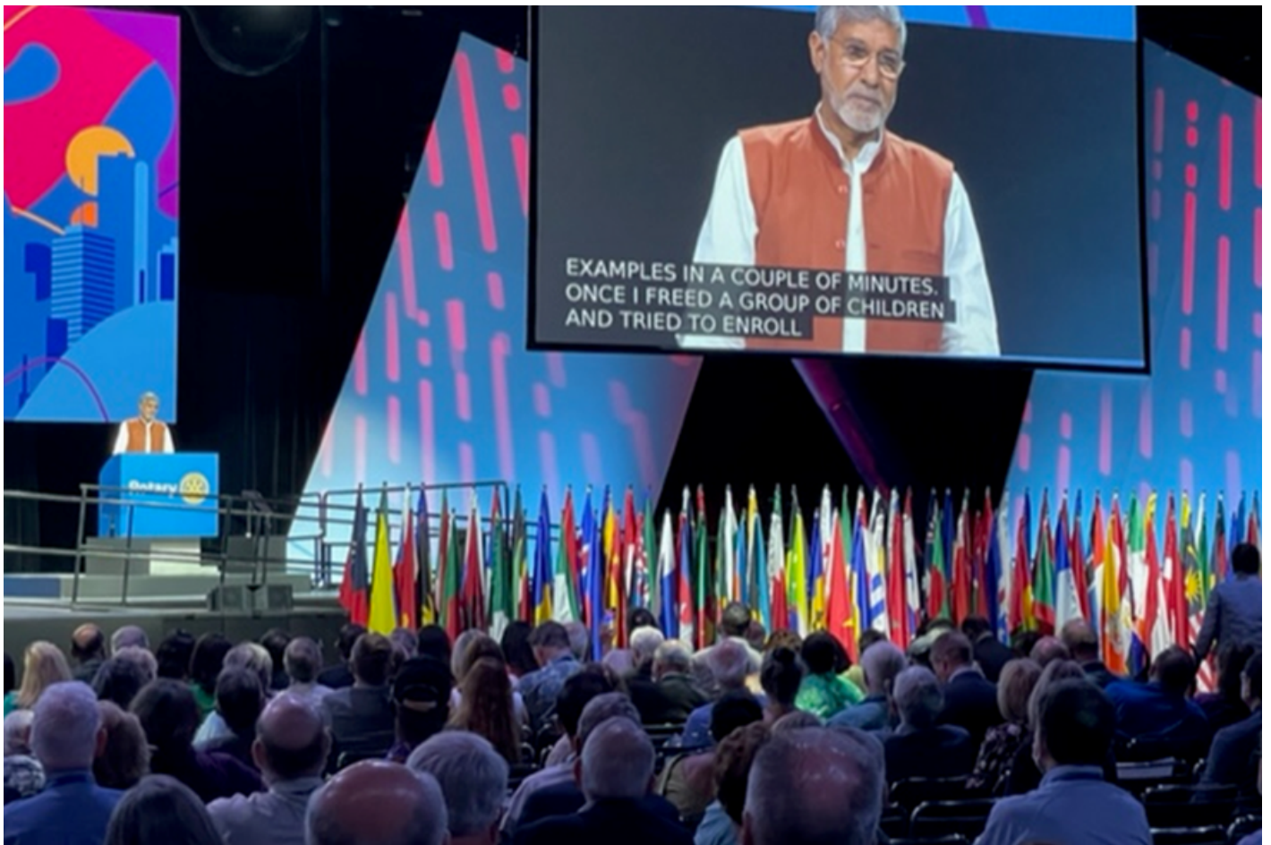
2014 fredsprisvinner Kailash Saatyarthi var svært engasjerende