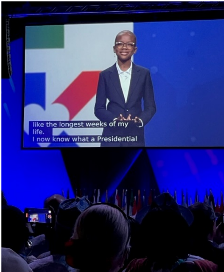
American Kid of the Year 2021